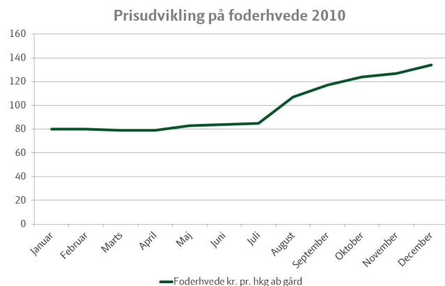
Figur 1. Pris på foderhvede i 2010. Kr. pr. hkg ab gård.

Prisen på foderhvede var i begyndelse af 2010 ca. 80 kr. pr. hkg (se farmtalonline.dk ), og den var nogenlunde konstant frem til juli. Herefter steg prisen til over 130 kr. pr. hkg inden udgangen af 2010. Der er tale om den gennemsnitligt fakturerede pris i den enkelte måned. Korn solgt i den enkelte måned kan være handlet til andre priser end de priser, der er vist i figuren, da de dækker både det handlede i den enkelte måned og det, der er solgt på kontrakt på et tidligere tidspunkt.